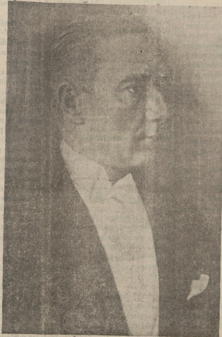
Cumhuriyet Halk Fırkasının büyük kurucusu ve önderi GAZİ HAZRETLERİ